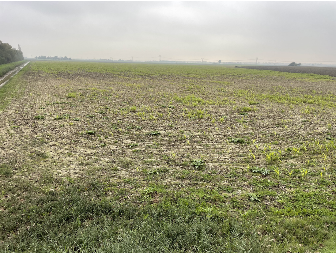
Dettaglio dell'area interessata nella porzione nord.